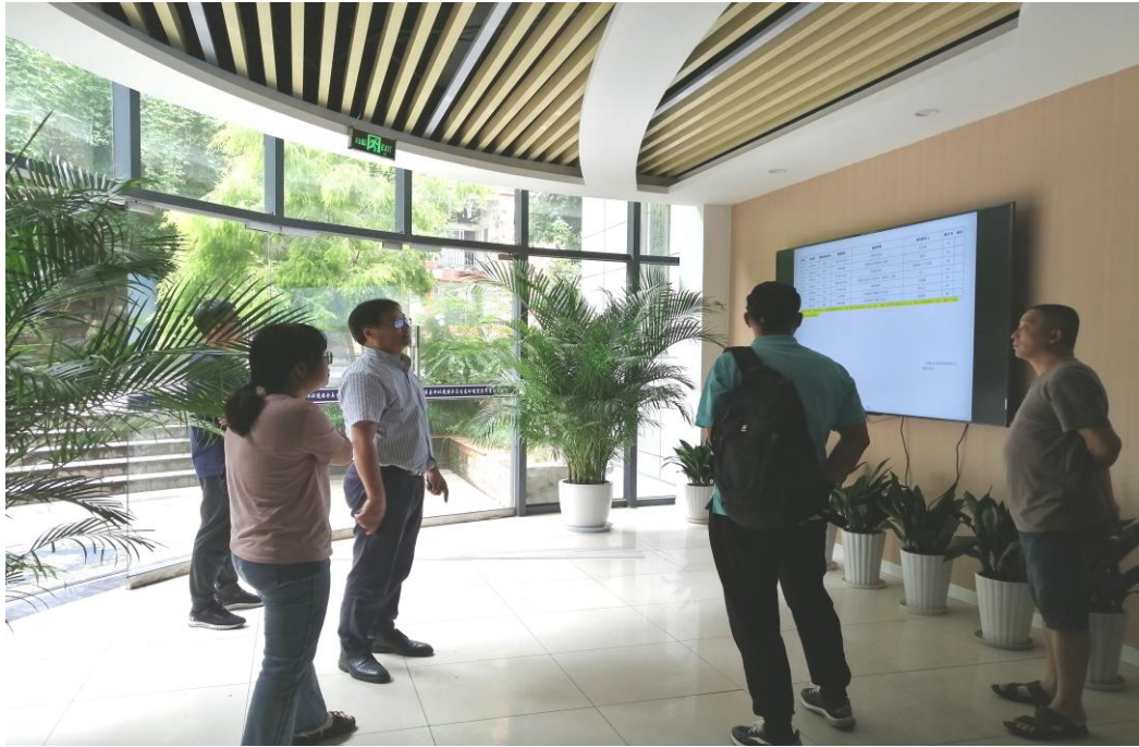
“中秋”节前院领导专项安全检查现场